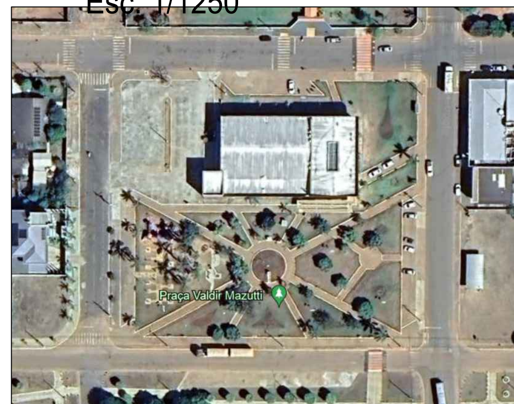
PLANTA DE LOCAÇÃO Esc: 1/1250